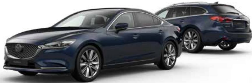
DEEP CRYSTAL BLUE MICA