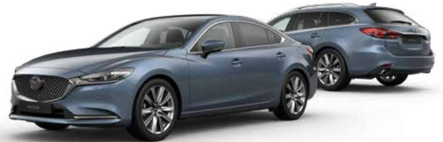
BLUE REFLEX MICA