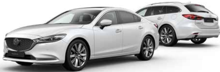
SNOWFLAKE WHITE PEARL