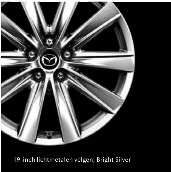
19-inch lichtmetalen velgen, Bright Silver