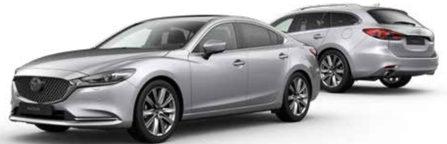
SONIC SILVER METALLIC