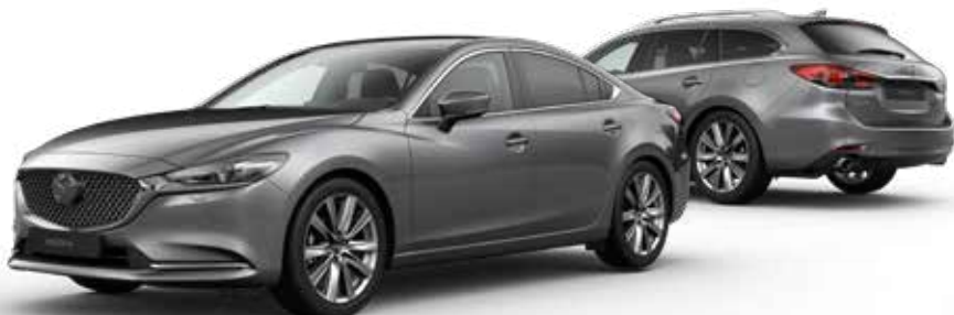
MACHINE GRAY METALLIC