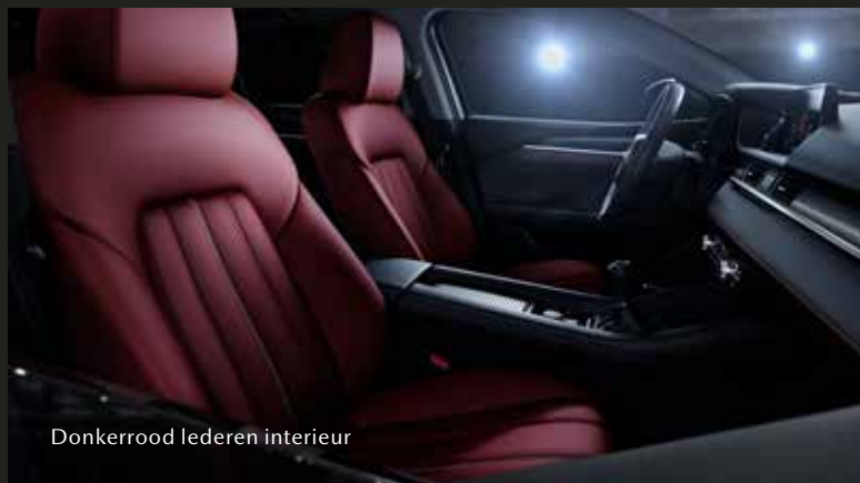
Donkerrood lederen interieur