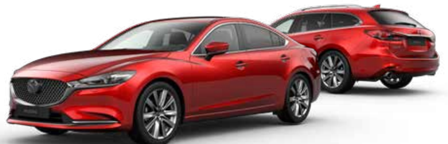
SOUL RED CRYSTAL METALLIC