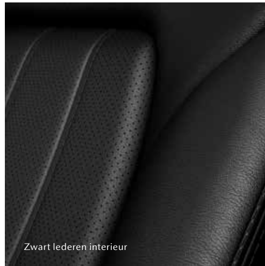
Zwart lederen interieur