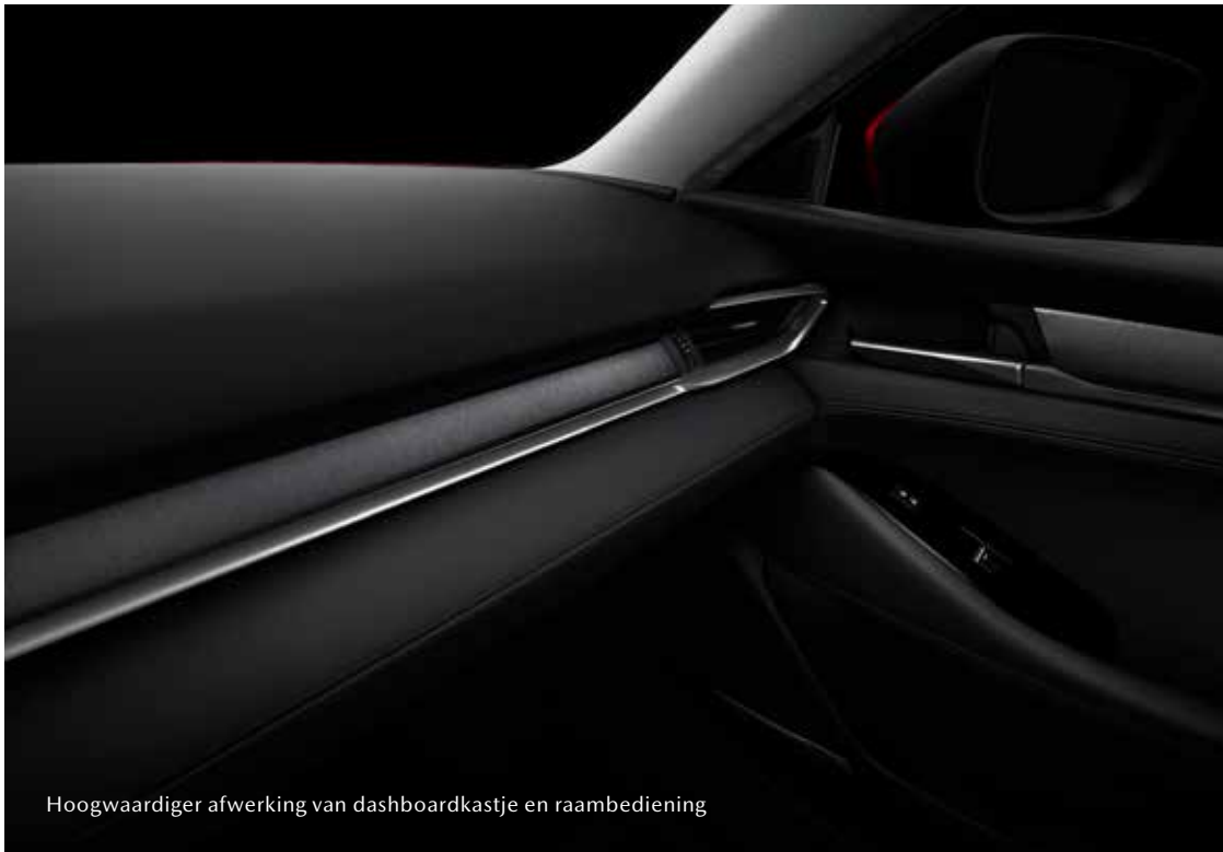
Hoogwaardiger afwerking van dashboardkastje en raambediening