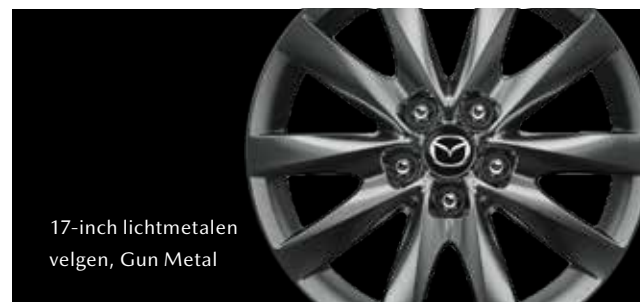
17-inch lichtmetalen velgen, Gun Metal