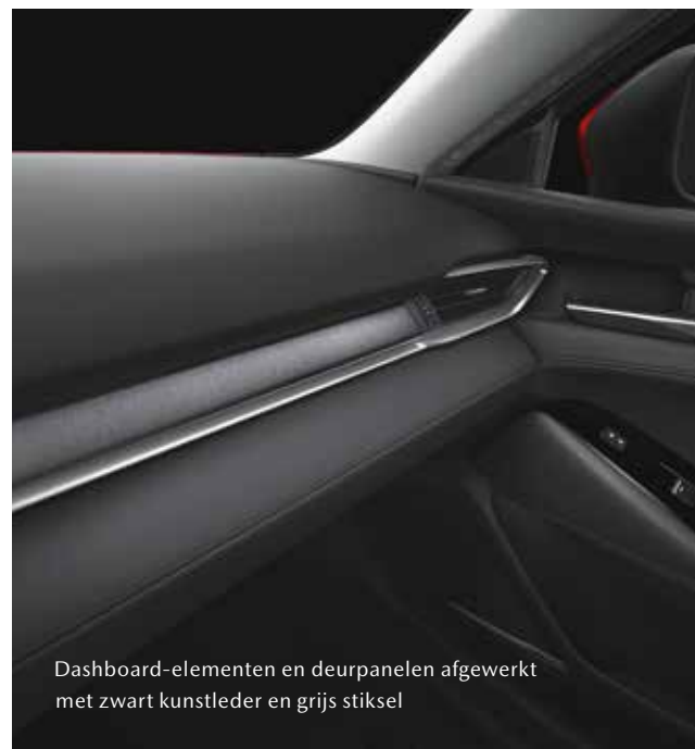
Dashbord-elementen en deurpanelen afgewerkt met zwart kunstleder en grijs stiksel