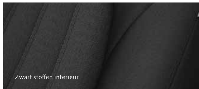
Zwart stoffen interieur