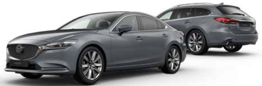
POLYMETAL GRAY METALLIC