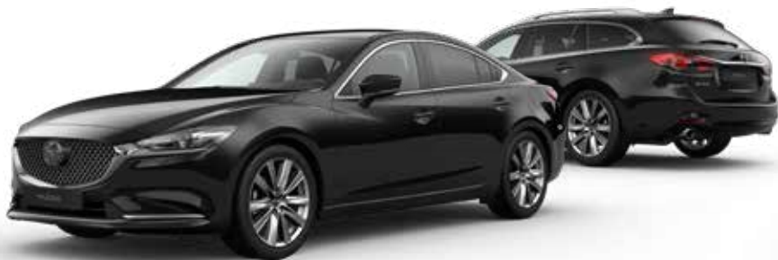
JET BLACK MICA

Je hebt de keuze uit tien kleuren. Arctic White Solid vormt de basis. Machine Gray Metallic en Soul Red Crystal Metallic zijn het meest exclusief. Een speciale laktechniek met nog kleinere en heldere aluminiumdeeltjes zorgt voor een ongekend diepe, heldere kleur.