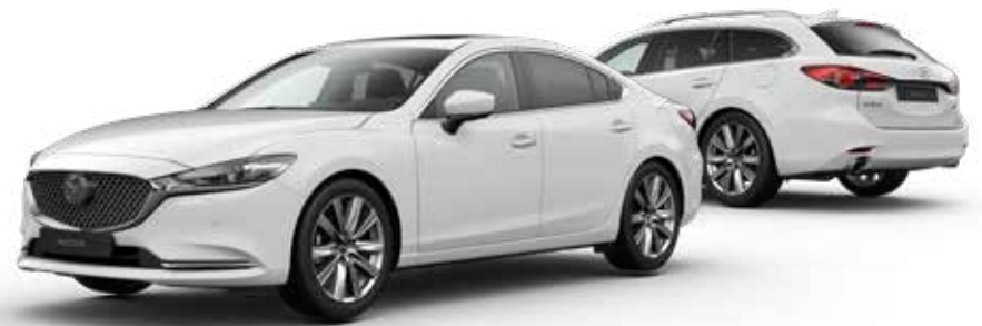
ARCTIC WHITE SOLID

Bekijk de Mazda6 Sportbreak in 360 graden