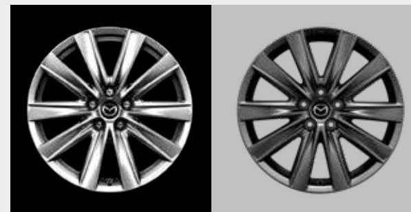
19-inch lichtmetalen velgen, in Bright Silver of Gun Metal