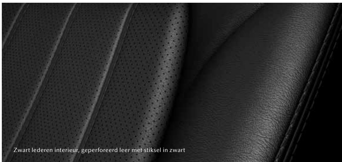
Zwart lederen interieur, geperforeerd leer met stiksel in zwart