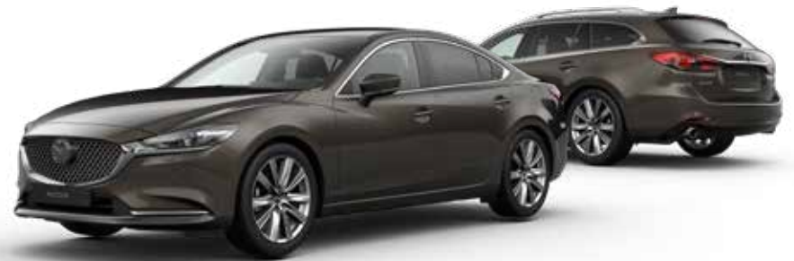
TITANIUM FLASH MICA