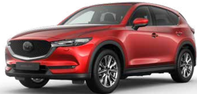
SOUL RED CRYSTAL METALLIC