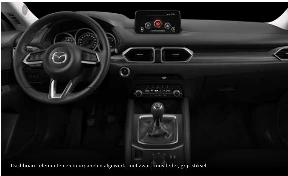
Dashboard-elementen en deurpanelen afgewerkt met zwart kunstleder, grijs stiksel