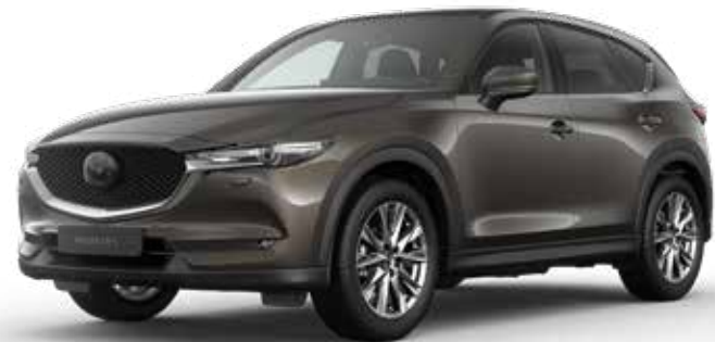
TITANIUM FLASH MICA