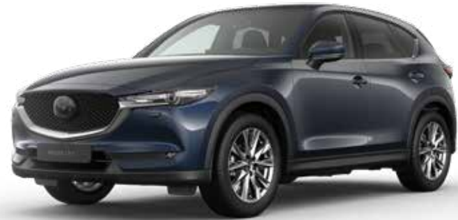
DEEP CRYSTAL BLUE MICA