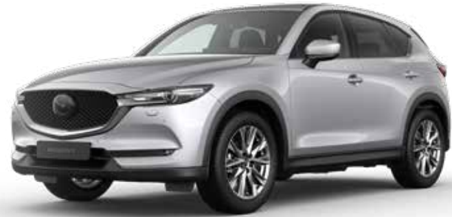
SONIC SILVER METALLIC