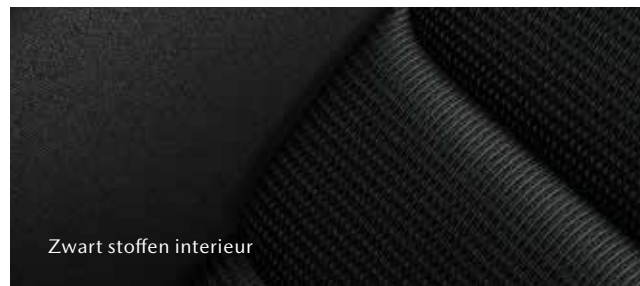
Zwart stoffen interieur