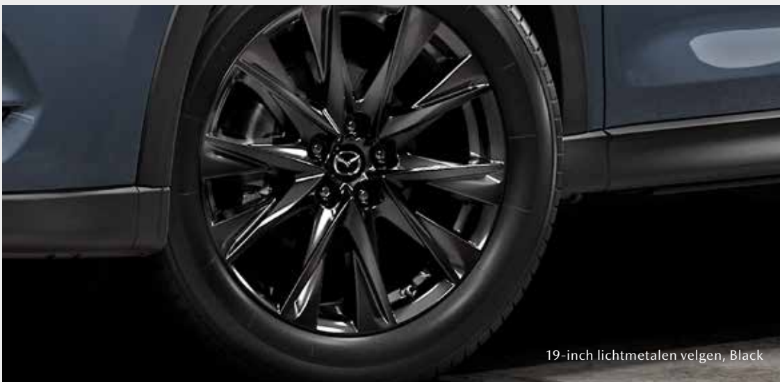
19-inch lichtmetalen velgen, Black