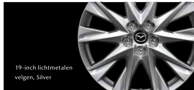
19-inch lichtmetalen velgen, Silver