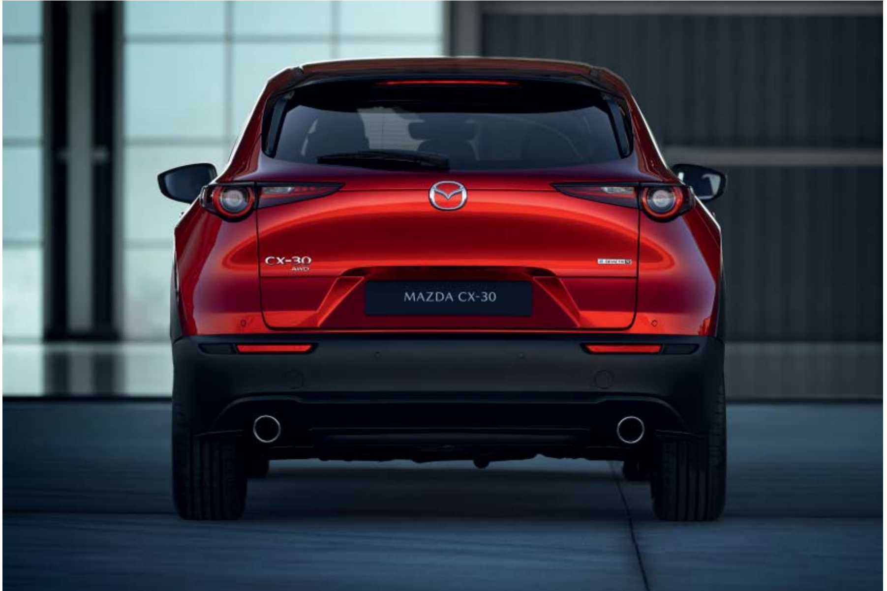
Foto: Mazda CX-30 als Luxury uitvoering in Soul Red Crystal