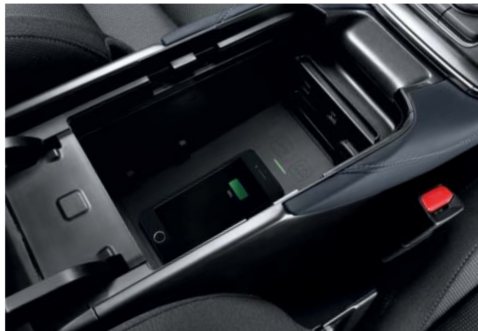
Draadloze oplader voor in de middenarmsteun