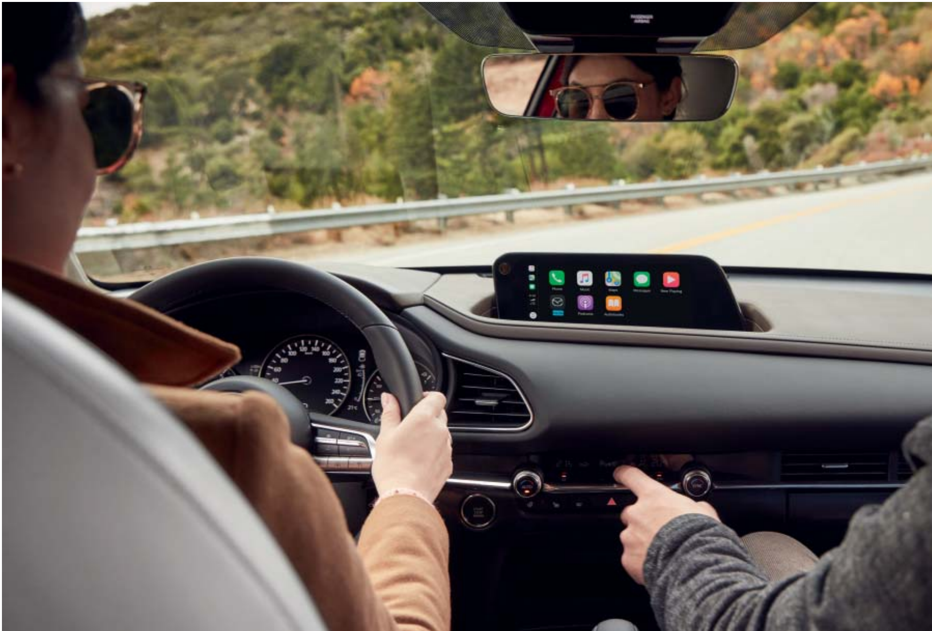
Foto: Mazda CX-30 als Luxury uitvoering in Soul Red Crystal met wit lederen interieur