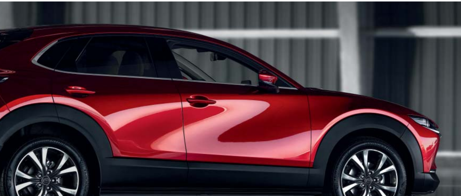
Foto: Mazda CX-30 als Luxury uitvoering in Soul Red Crystal