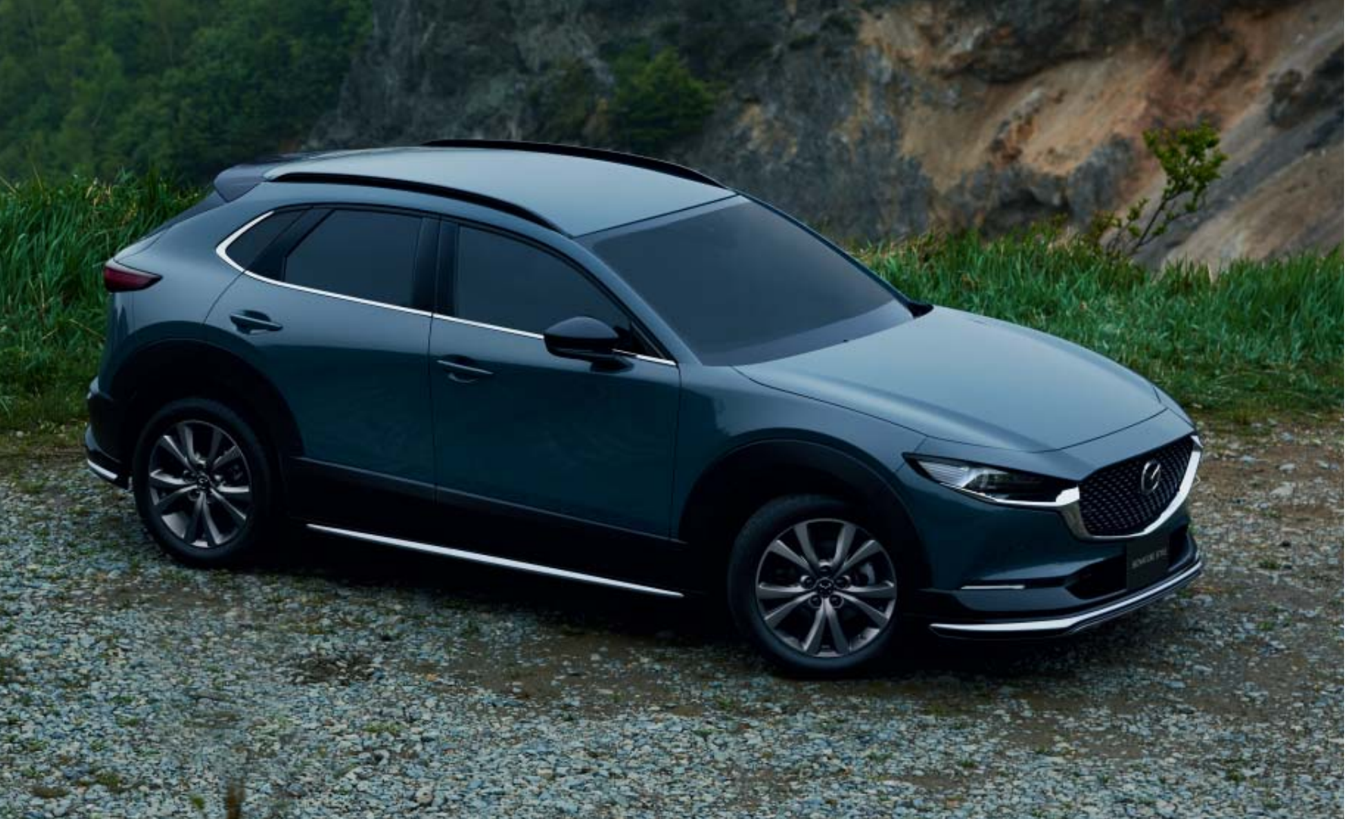
Sport pakket (voor- en achterbumperspoiler en zijskirtset) en spiegelkappen in Brilliant Black Roofrails in Black