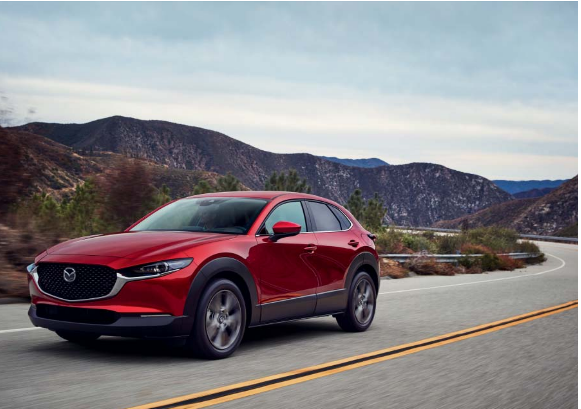
Foto: Mazda CX-30 als Luxury uitvoering in Soul Red Crystal