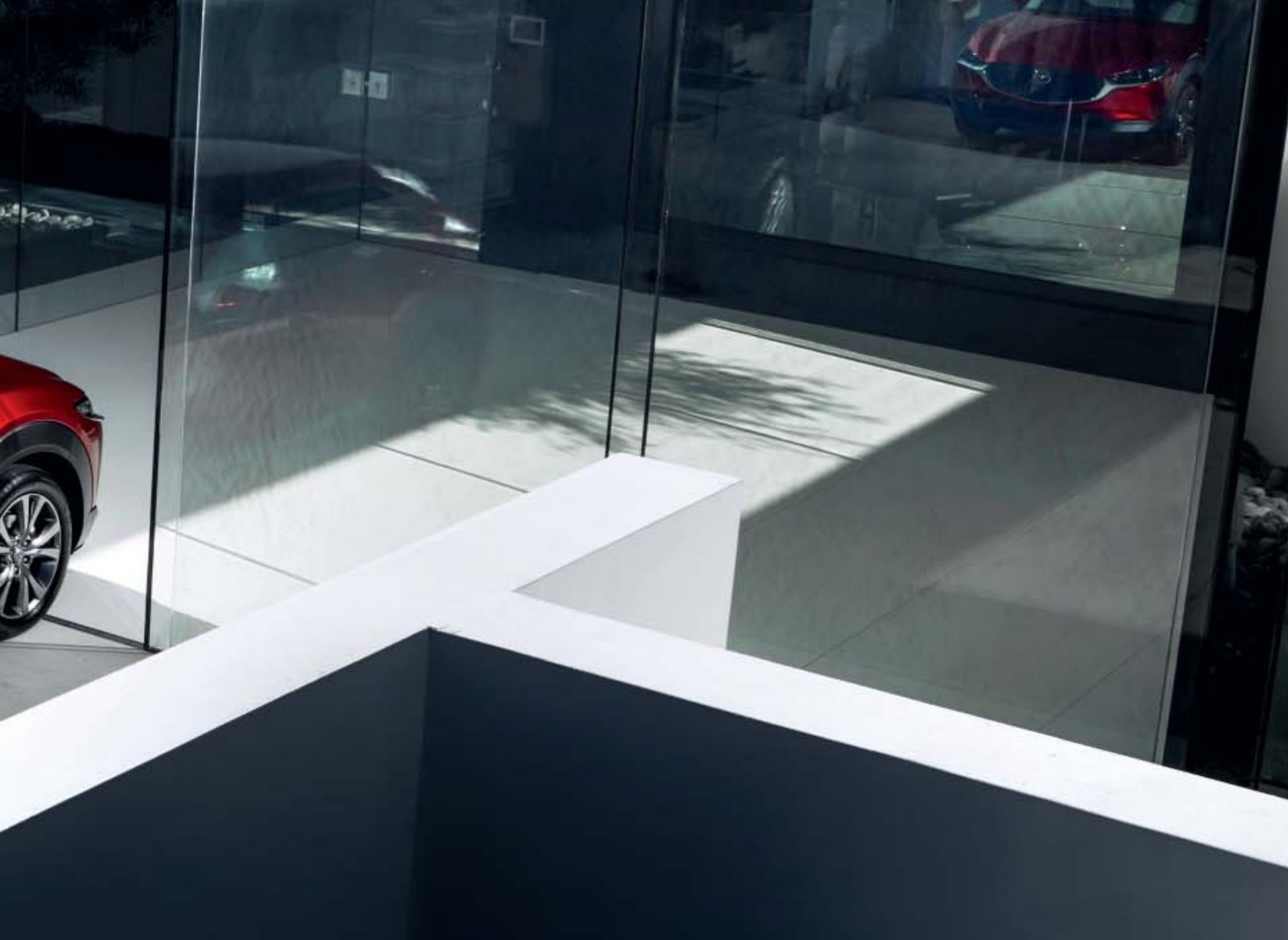
Foto: Mazda CX-30 als Luxury uitvoering in Soul Red Crystal