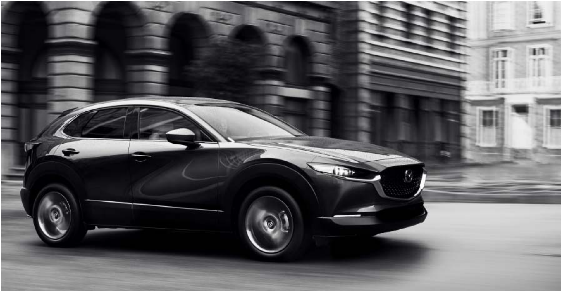
Foto: Mazda CX-30 als Luxury uitvoering in Soul Red Crystal