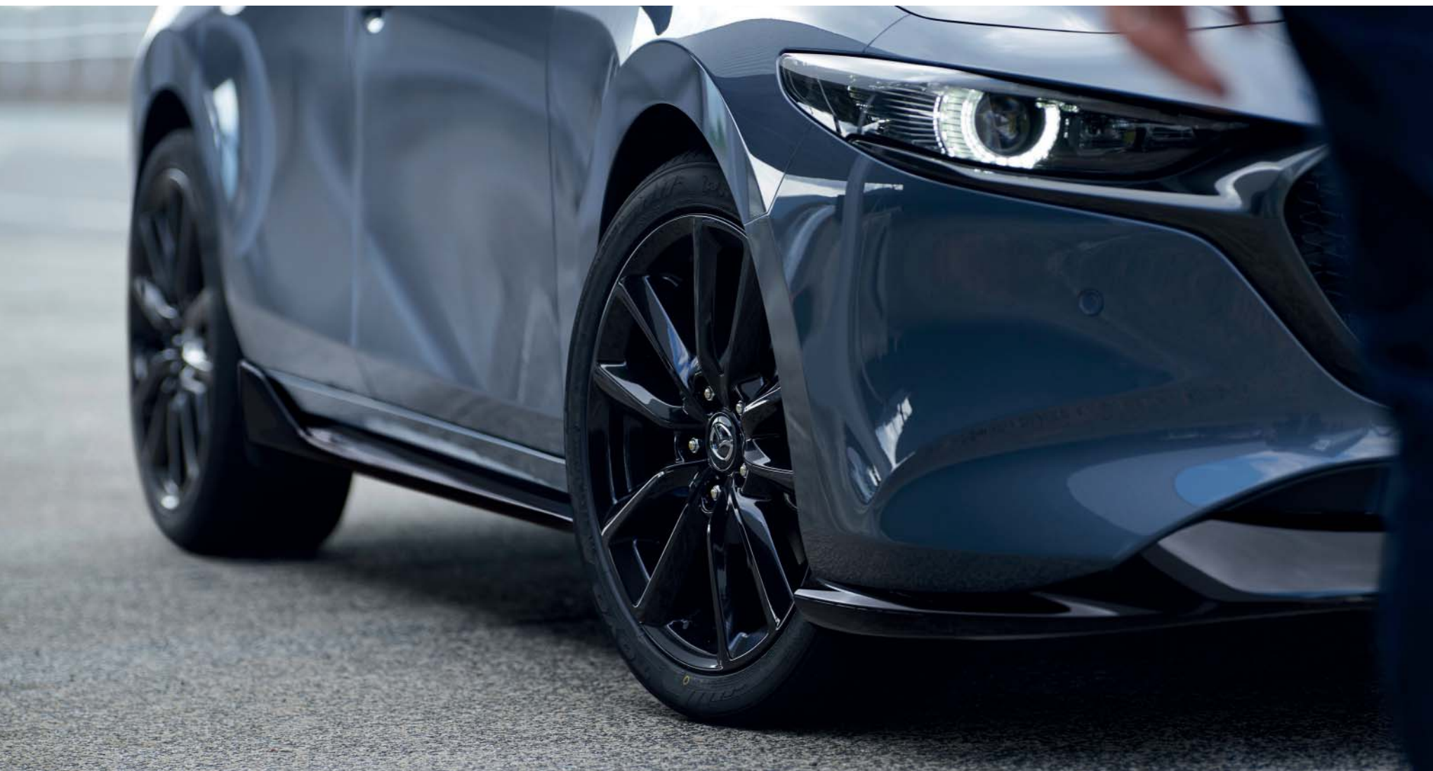
Sport pakket (voor-, bumper- en dakspoiler en zijskirtset) in Black 18-inch lichtmetalen velgen in Black Metallic