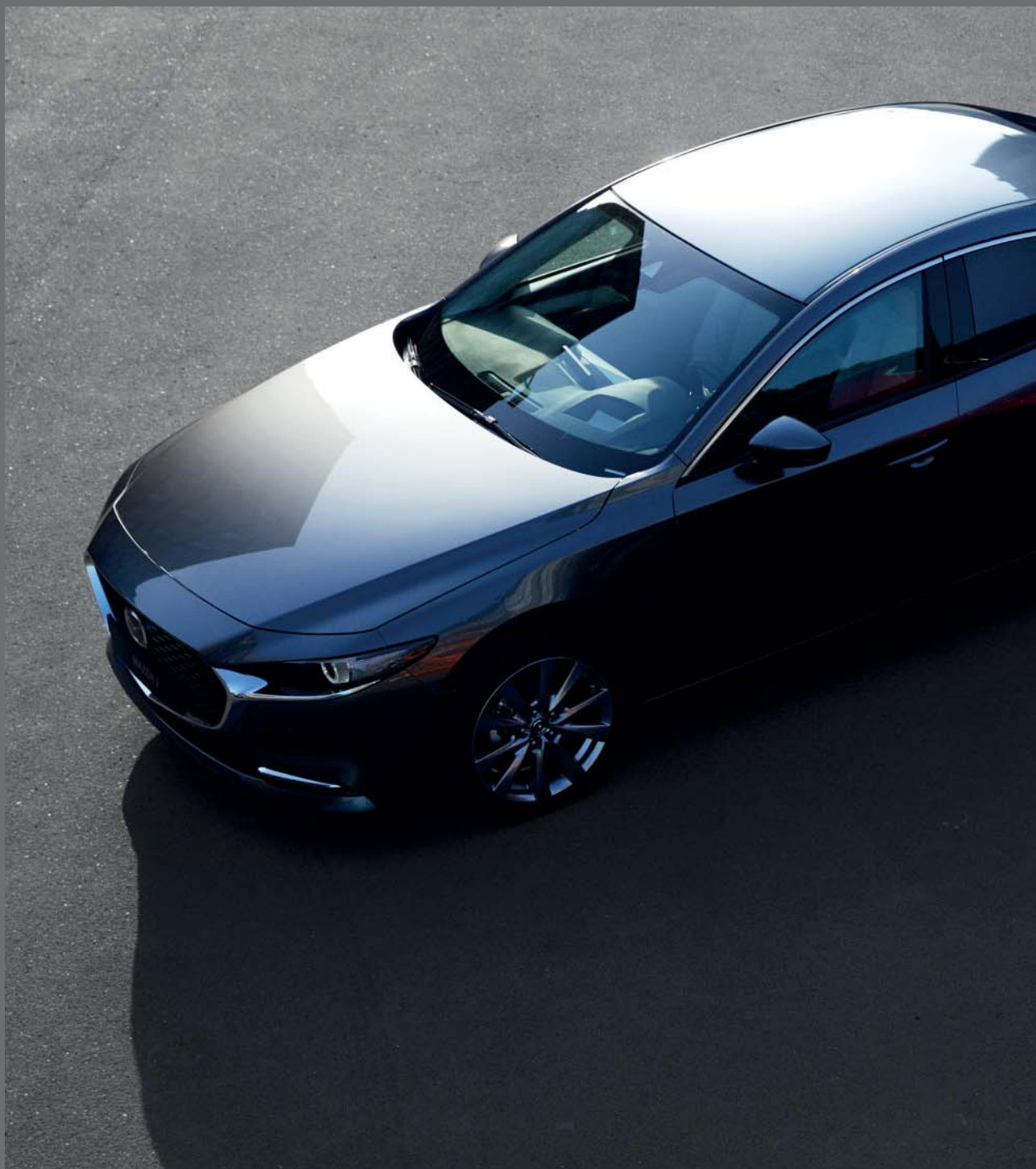
Foto rechts: Mazda3 Sedan als Luxury uitvoering in Machine Gray en Mazda3 Hatchback als Luxury uitvoering in Soul Red Crystal (velgen afhankelijk van motorisatie)