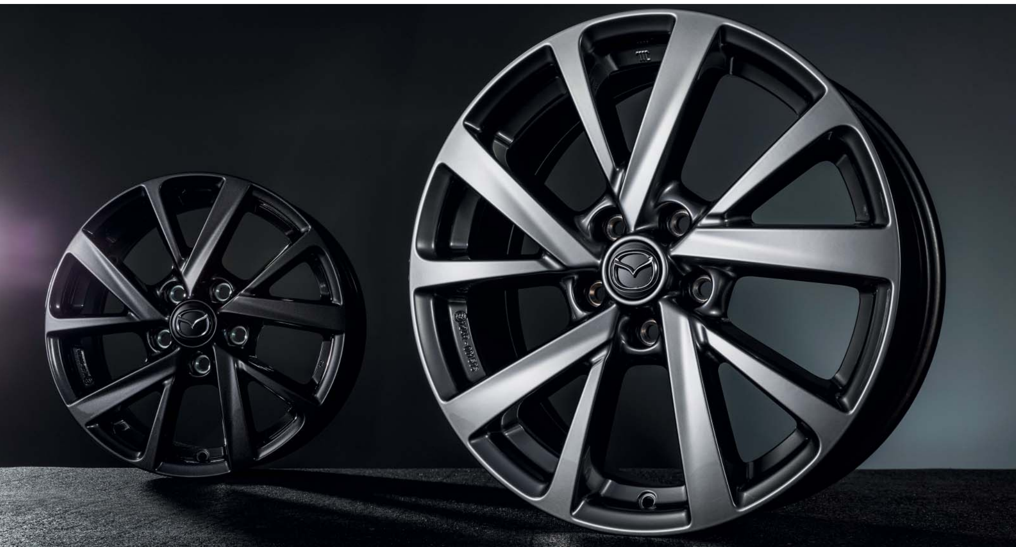
18-inch lichtmetalen velgen in Chrome Shadow