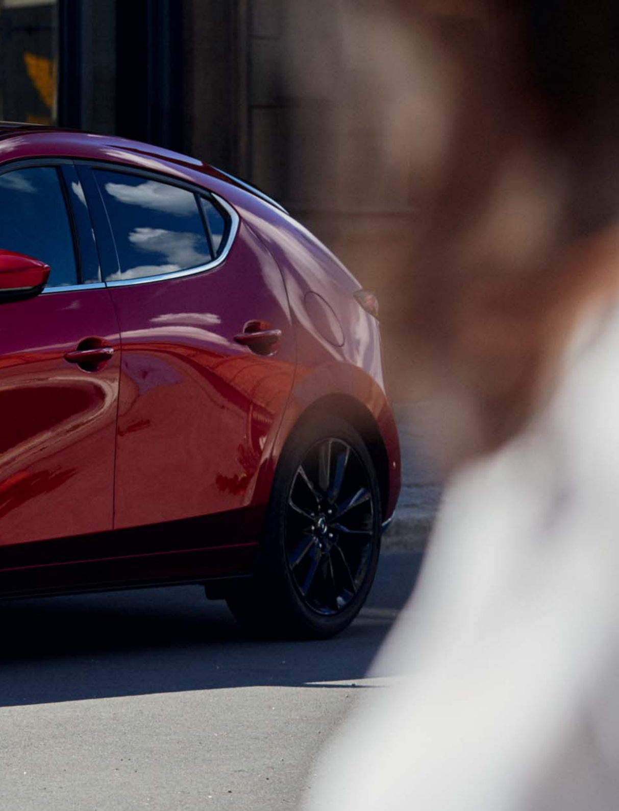
Foto links: Mazda3 Hatchback als Luxury uitvoering in Soul Red Crystal (zwarte velg enkel op Skyactiv-X als Luxury uitvoering of beschikbaar als accessoire)