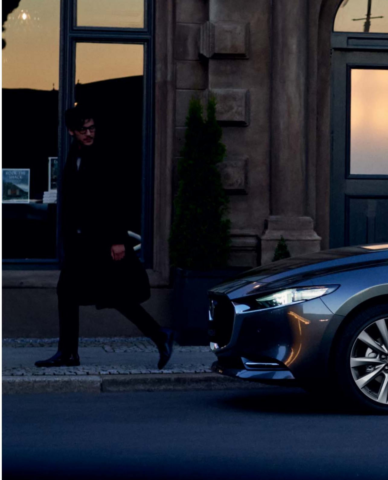
Foto rechts: Mazda3 Sedan als Luxury uitvoering in Machine Gray (Bright Silver velg enkel op Skyactiv-X als Luxury uitvoering of beschikbaar als accessoire)