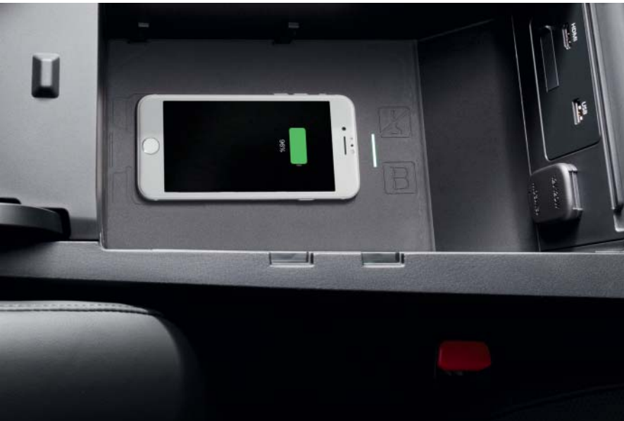
Draadloze oplader voor in de middenarmsteun

Met veel zorg heeft Mazda dealeropties ontworpen die perfect bij jouw Mazda3 passen. Ga voor een volledige lijst met originele Mazda dealeropties voor de Mazda3 naar onze website.