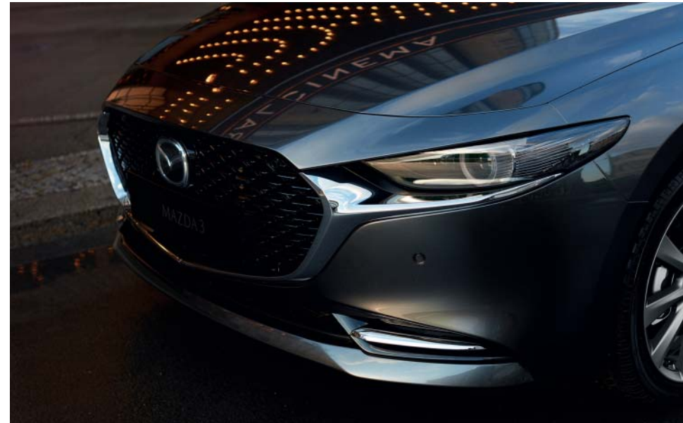
Foto links & boven: Mazda3 Sedan als Luxury uitvoering in Machine Gray met Pure White lederen interieur (optioneel op Sedan met Skyactiv-X) (Bright Silver velg enkel op Skyactiv-X als Luxury uitvoering of beschikbaar als accessoire)