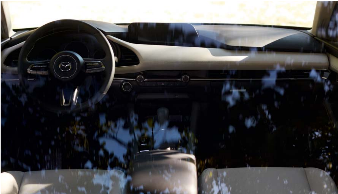
Foto links: Mazda3 Sedan als Luxury uitvoering Foto rechts: Mazda3 Sedan als Luxury uitvoering in Machine Gray (Bright Silver velg enkel op Skyactiv-X als Luxury uitvoering of beschikbaar als accessoire)

Het design van de Mazda3 bewijst dat onze vakmensen de kunst van het weglaten tot in de puntjes beheersen. Je kunt er je ogen niet vanaf houden.