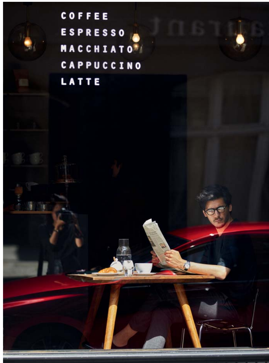
Foto links: Mazda3 Hatchback als Luxury uitvoering in Soul Red Crystal (zwarte velg enkel op Skyactiv-X als Luxury uitvoering of beschikbaar als accessoire)