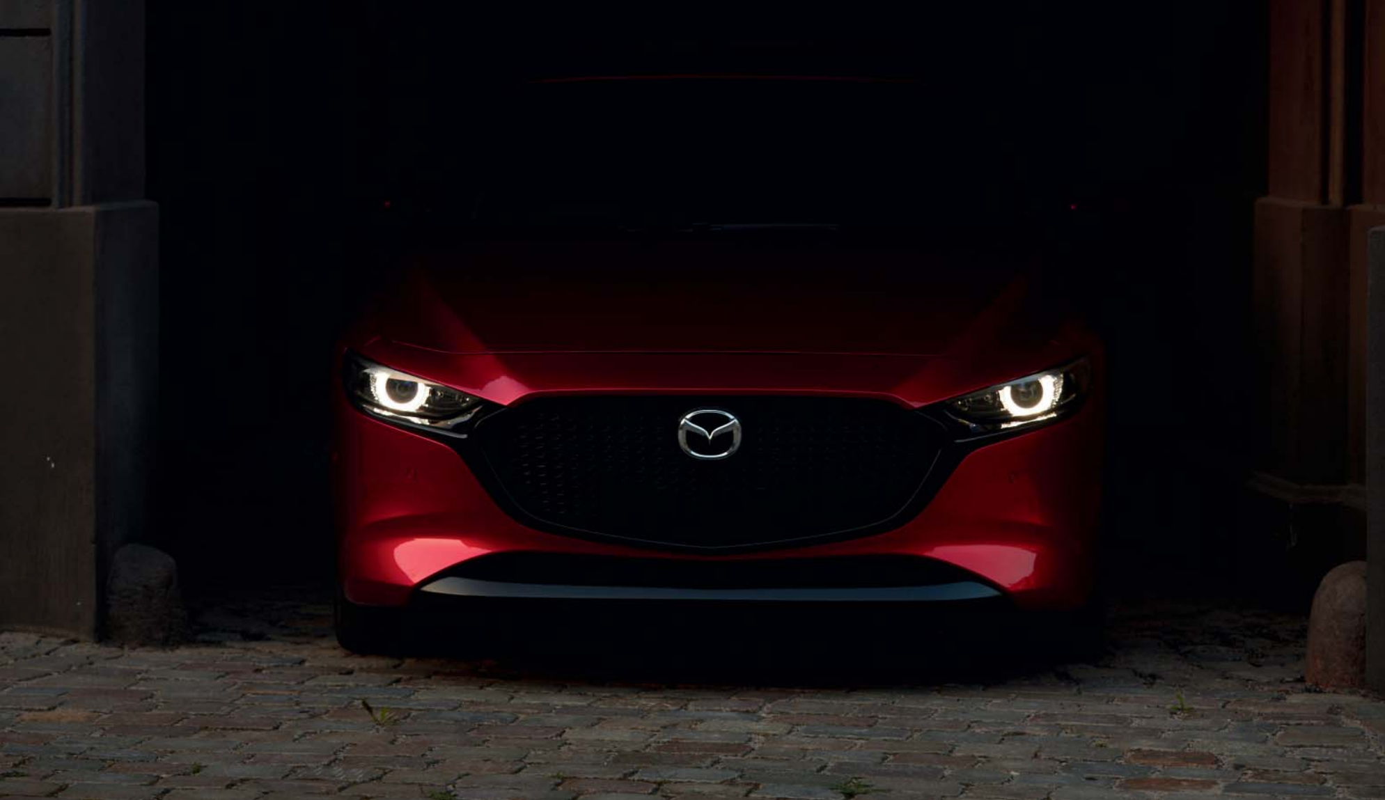
Foto boven: Mazda3 Hatchback als Luxury uitvoering in Soul Red Crystal