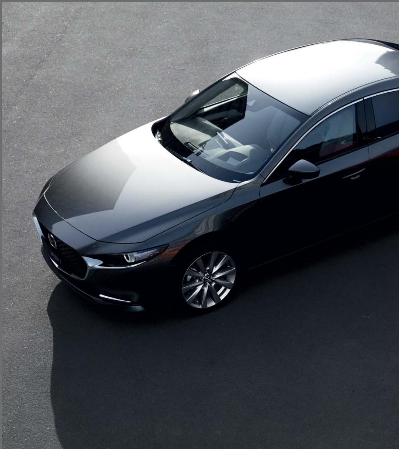
Foto rechts: Mazda3 Sedan als Luxury uitvoering in Machine Gray en Mazda3 Hatchback als Luxury uitvoering in Soul Red Crystal (velgen afhankelijk van motorisatie)