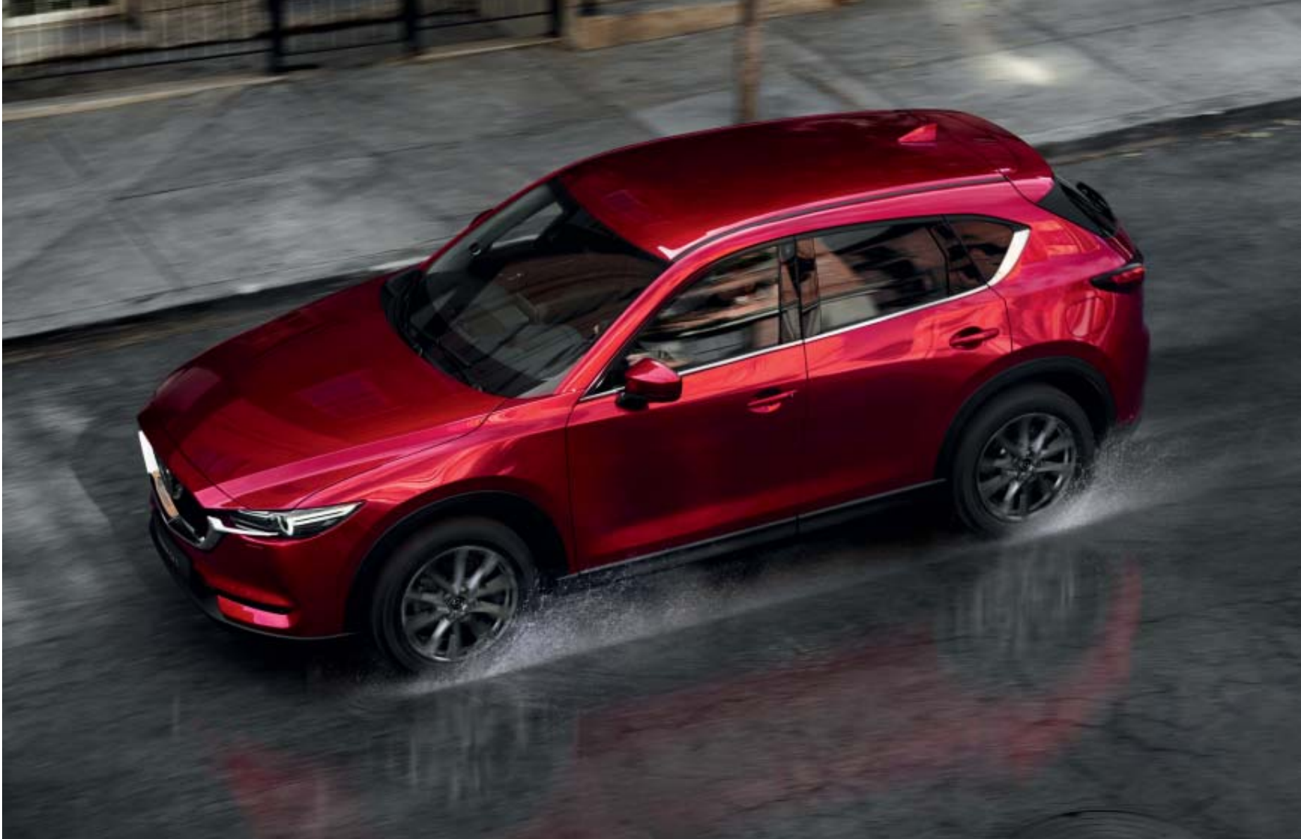
Foto: Mazda CX-5 als Luxury uitvoering in Soul Red Crystal