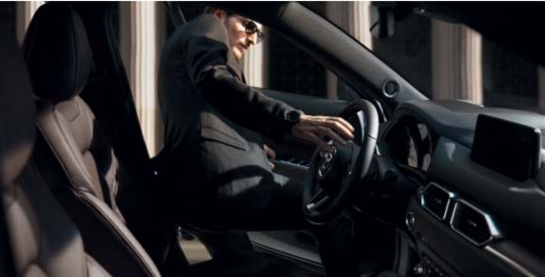
Foto links: Mazda CX-5 als Signature uitvoering Foto rechts: Mazda CX-5 als Luxury uitvoering in Soul Red Crystal

Sinds zijn introductie gooit de Mazda CX-5 hoge ogen, en won hij prijs op prijs. Met de nieuwe versie doen we daar nog een schepje bovenop. De hoge instap, de hoge trekkracht en het hoge afwerkingsniveau maken de verwachtingen meer dan waar. Maar het zijn de rijeigenschappen die hem echt naar grote hoogte brengen. Door een uitgebalanceerd onderstel stuurt hij als een sportieve sedan, waardoor elke bestuurder zich één voelt met de auto. En dat is ongekend voor dit segment.