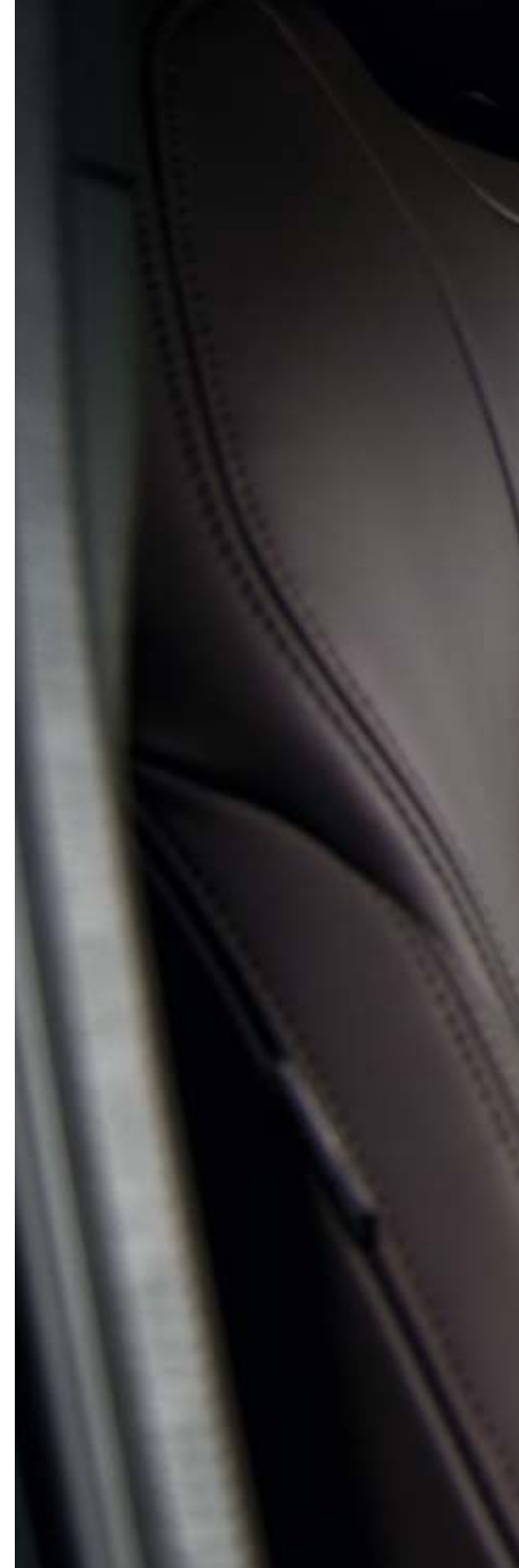
Foto: Mazda CX-5 als Signature uitvoering met donkerbruin Nappa-lederen interieur

Mazda beseft hoe belangrijk de zintuigen zijn voor de beleving. Door de zorgvuldig gekozen materialen en kleurenschema's oogt het interieur minder druk. De combinatie van zachte materialen, stevige stiksels en rustgevende vormgeving zorgen voor een uniek interieur wat je zintuigen aanspreekt. Of je nu kiest voor een stoffen of lederen interieur.