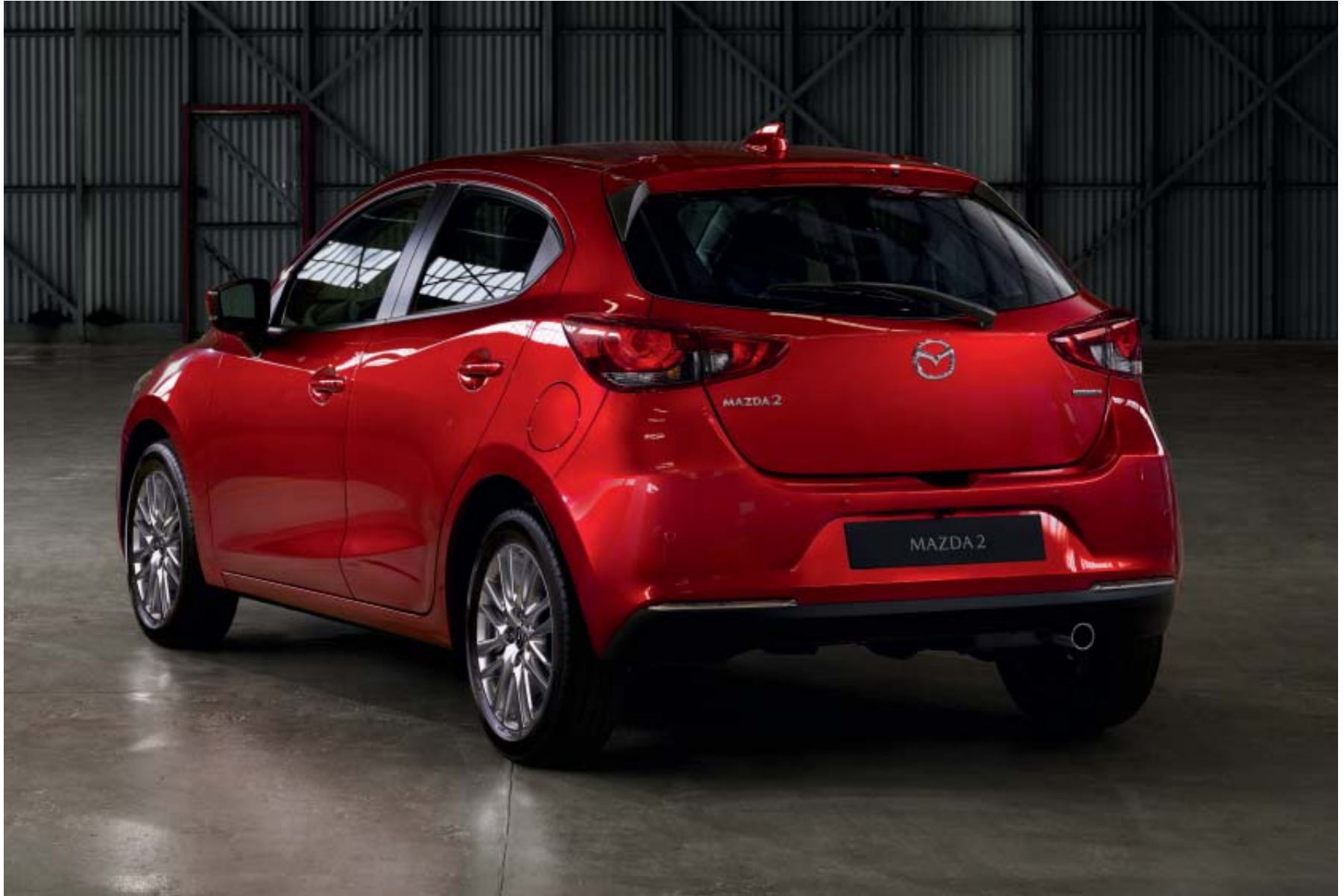
Foto: Mazda2 als Signature uitvoering in Soul Red Crystal