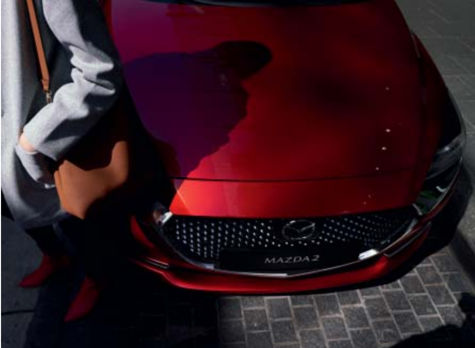
Foto: Mazda2 als Signature uitvoering in Soul Red Crystal