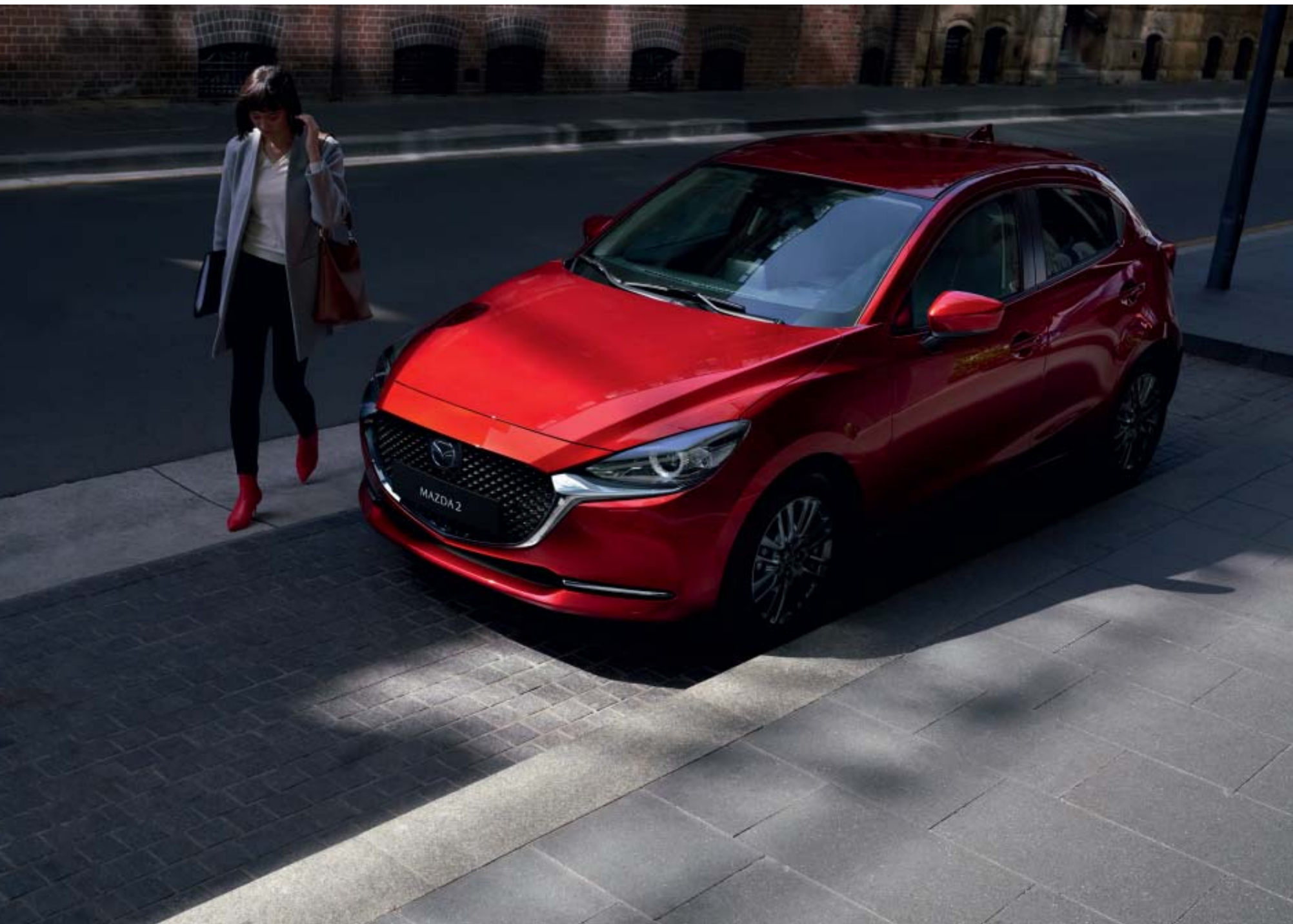
Foto: Mazda2 als Signature uitvoering in Soul Red Crystal