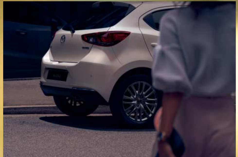
Foto rechts: Mazda2 als Signature uitvoering in Snowflake White Pearl