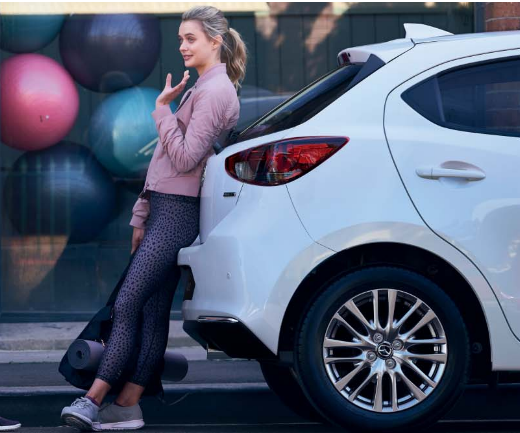
Foto boven, rechts: Mazda2 als Signature uitvoering in Snowflake White Pearl