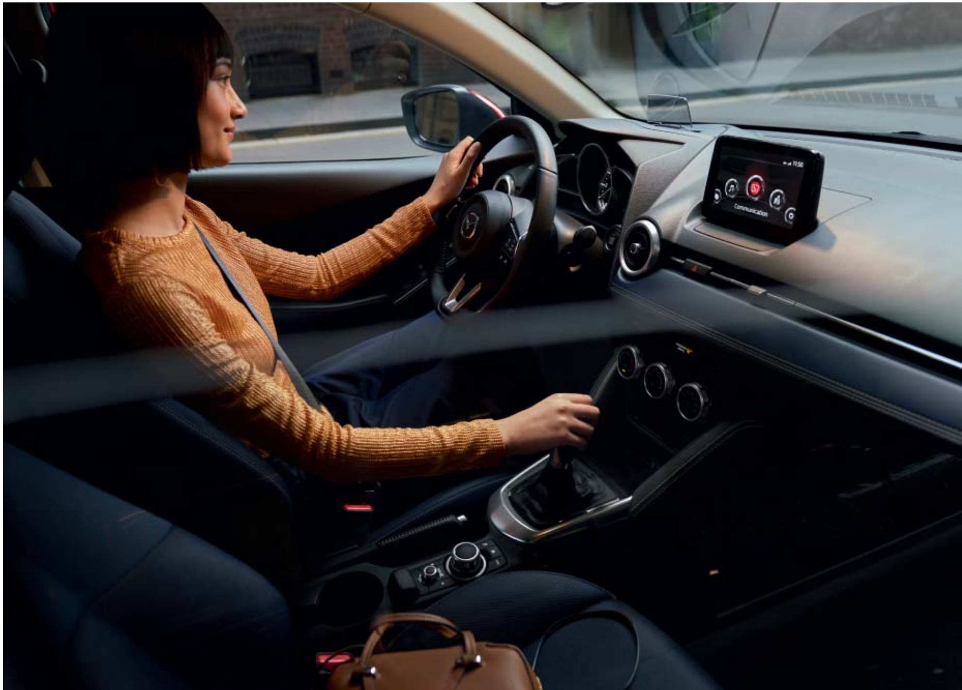
Foto boven: Mazda2 als Luxury uitvoering met i-Activsense pakket in Soul Red Crystal met donkerblauw stoffen interieur