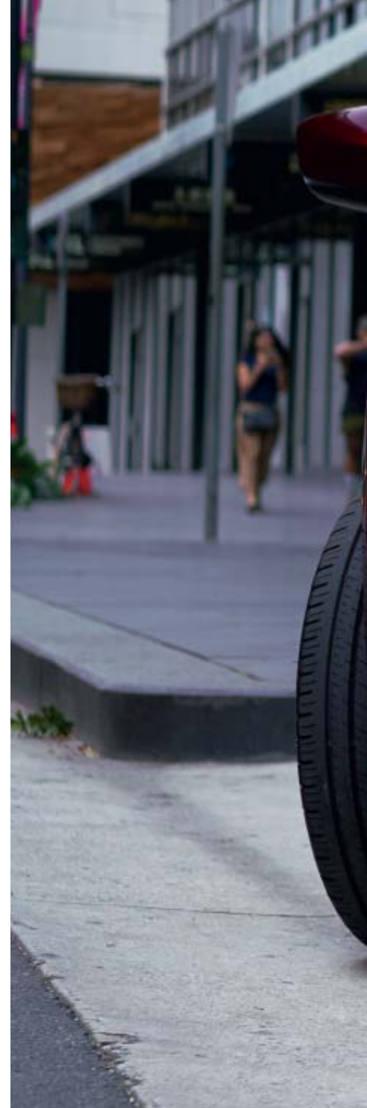
Foto boven: Mazda2 als Luxury uitvoering met donkerblauw stoffen interieur Foto rechts: Mazda2 als Signature uitvoering in Soul Red Crystal

Vanbinnen is de Mazda2 ook opmerkelijk verfijnd. Hij oogt minder druk, dankzij de zorgvuldig gekozen materialen en kleurenschema's. En het verbeterde stoelontwerp zorgt voor een ideale zithouding tijdens het rijden. Verder is de Mazda2 een stuk stiller, onze benadering van geluidscontrole zorgt dat je alleen hoort wat je wilt horen. Zo creëren we een hoogwaardig en harmonieus interieur, dat meteen vertrouwd aanvoelt.