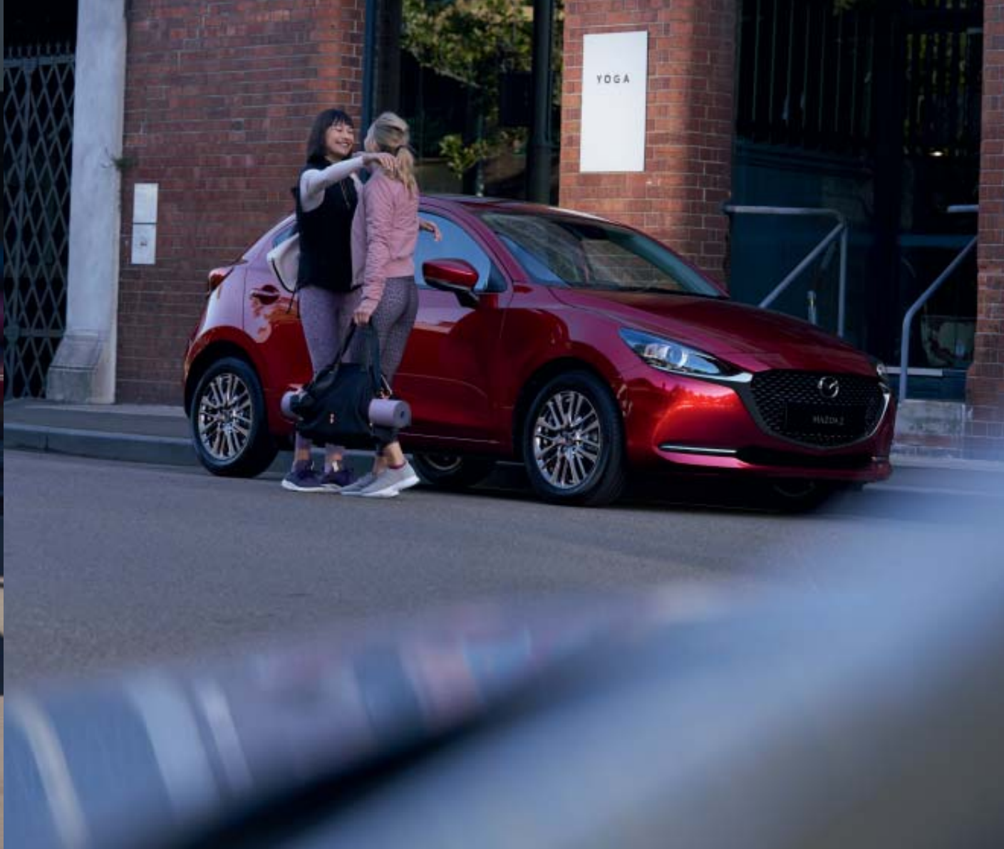
Foto boven & links: Mazda2 als Signature uitvoering in Soul Red Crystal