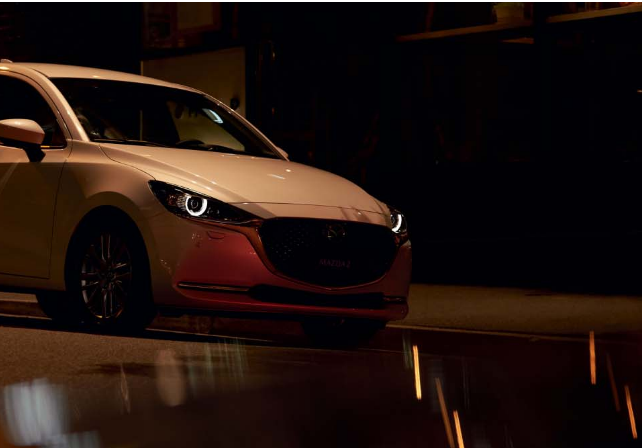
Foto boven: Mazda2 als Signature uitvoering in Snowflake White Pearl