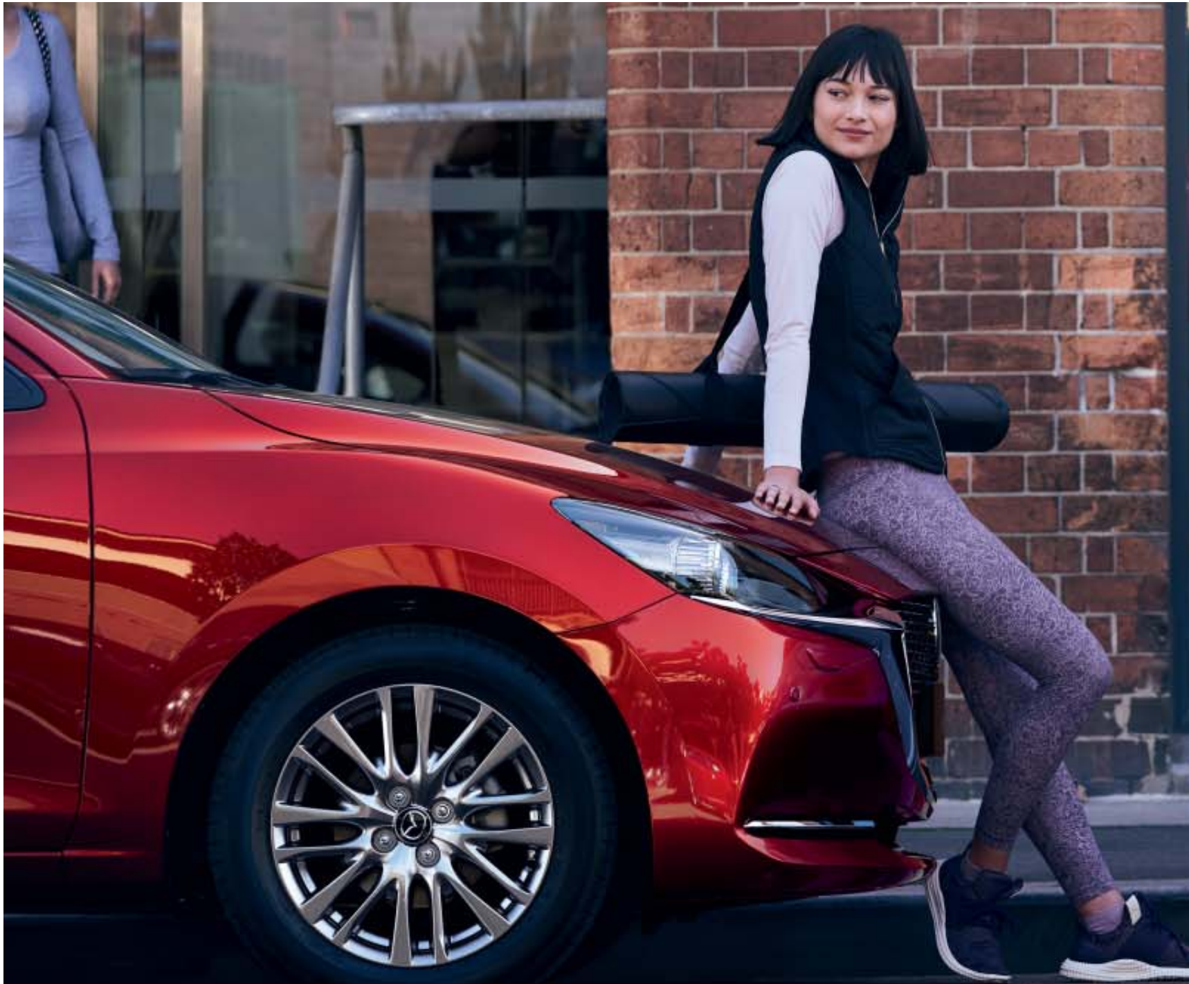
Foto boven, links: Mazda2 als Signature uitvoering in Soul Red Crystal