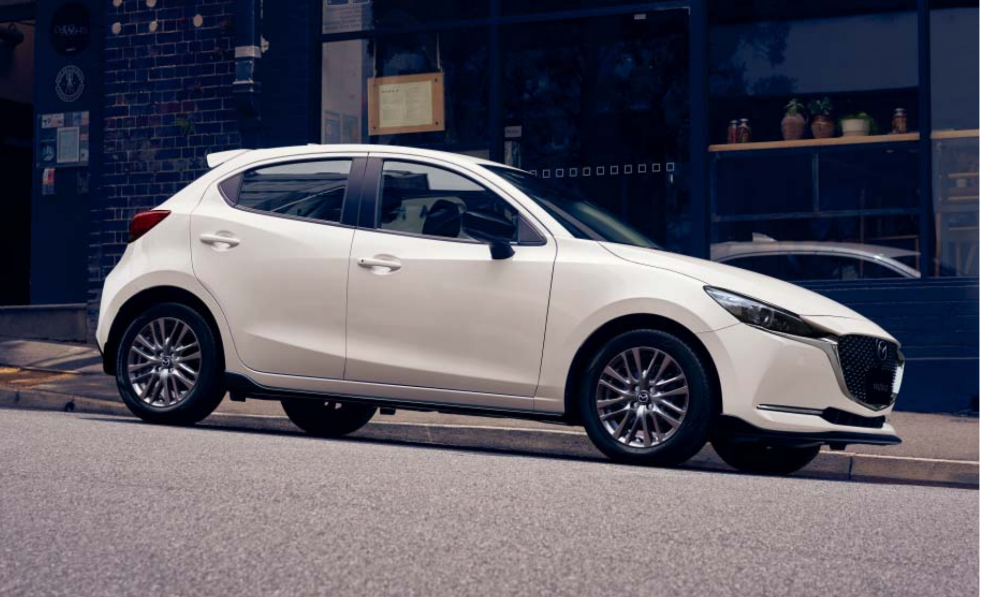
Foto boven: Mazda2 als Signature uitvoering in Snowflake White Pearl, aangevuld met o.a. zijskirts en zwarte spiegelkappen